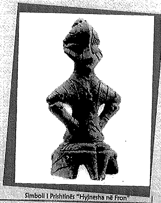
Simboli i Prishtinës "Hynerha në Fron"

Të gjitha këshillat dhe informatat janë pa pagesë.